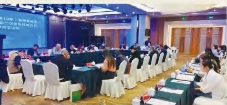
《庄子》应用研究交流会场