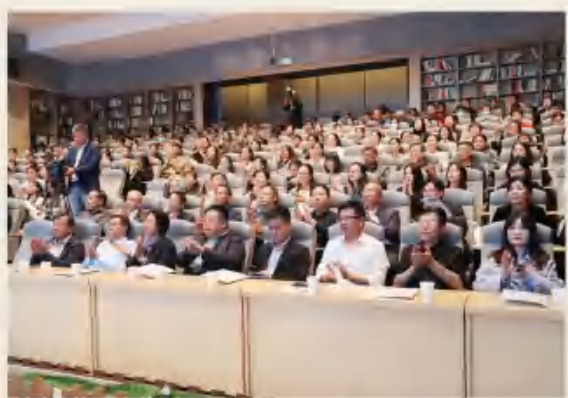
活动期间观摩古琴雅集