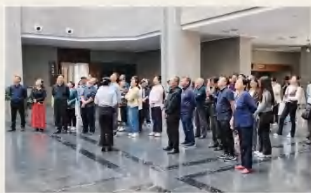
蒙城博物馆内开展主题研学