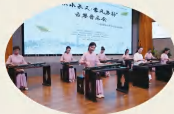
古琴雅集丰富庄学盛会内涵