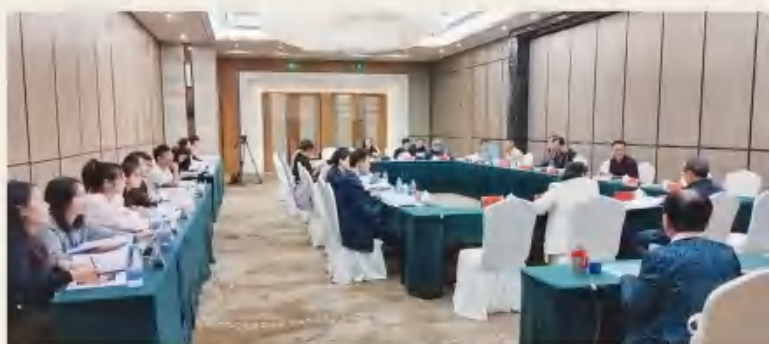
《庄子》文本研究交流会场