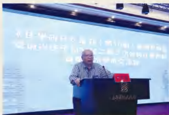
知名学者进行主题发言