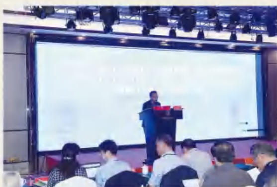
副会长主持主题发言