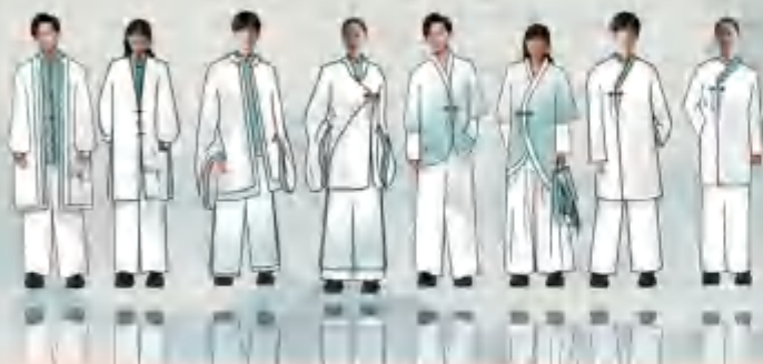
高校组一等奖作品“自然而染”

2020 "ZHUANGZI CUP" CULTURAL DESIGN CONTEST