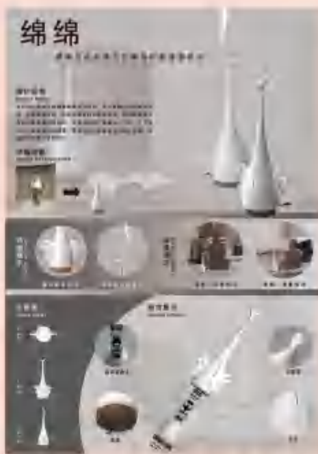
高校二等奖作品“绵绵：鸟形加湿器”