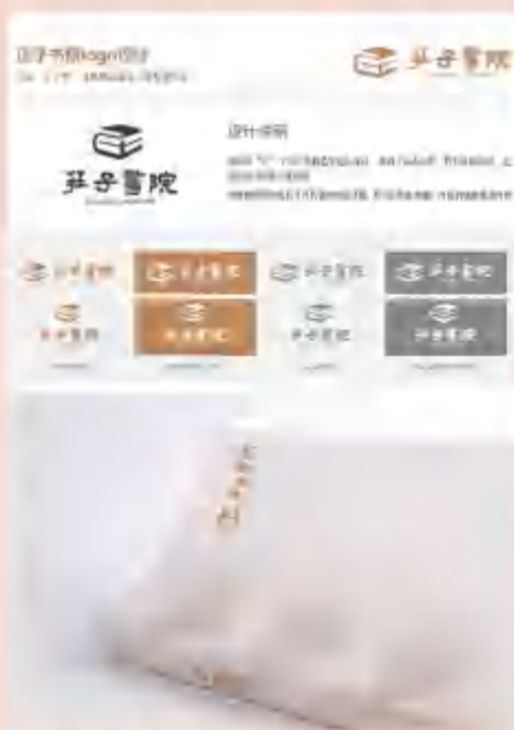
社会组一等奖作品“庄子书院LOGO”